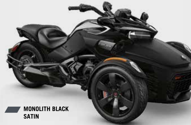
MONOLITH BLACK SATIN