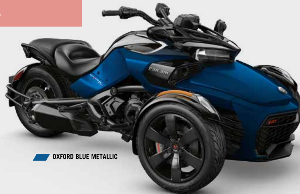
OXFORD BLUE METALLIC