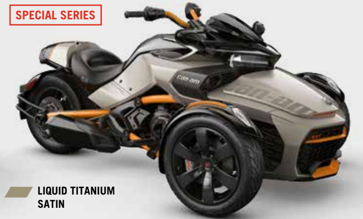
LIQUID TITANIUM SATIN